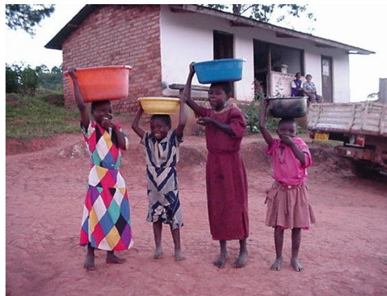
Wasser- und Hoffnungsträger auf Chipunga

Der Verein ist selbstlos tätig und verfolgt keine eigenwirtschaftliche Zwecke (§§ 51 ff. AO). Durch die Bescheinigung des Finanzamts Leonberg (Steuer-Nr.: 70054/39127) vom 11. August 2005 ist der Verein vorläufig ab dem Jahr 2004 nach § 5, Abs. 1, Nr. 9 des Körperschaftsteuergesetzes von der Körperschaftsteuer befreit.